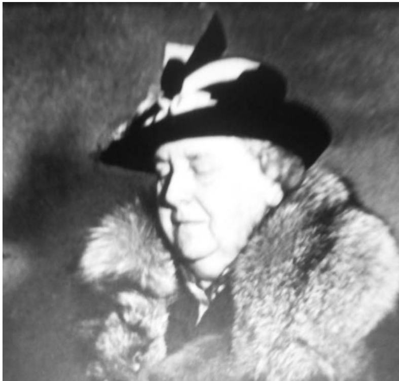
Hare Majesteit Koningin Wilhelmina

Voor meer historische stukjes kijk op historischekringdriemond.nl