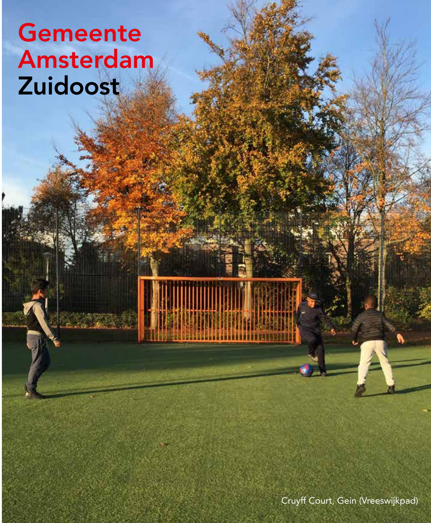
Cruyff Court, Gein (Vreeswijkpad)